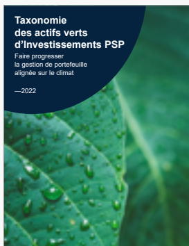
Taxonomie des actifs verts de PSP