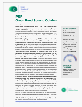
Deuxième avis sur les obligations vertes de PSP – CICERO Shades of Green