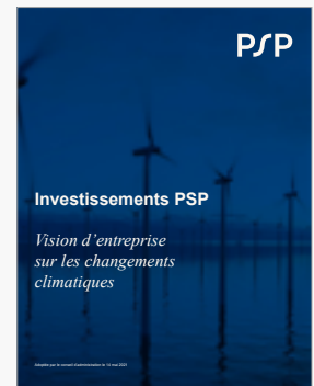
Vision d'entreprise de PSP sur les changements climatiques