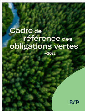
Cadre de référence des obligations vertes de PSP