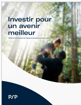
Rapport annuel 2022