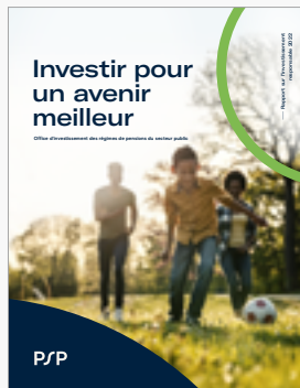
Rapport sur l'investissement responsable 2022